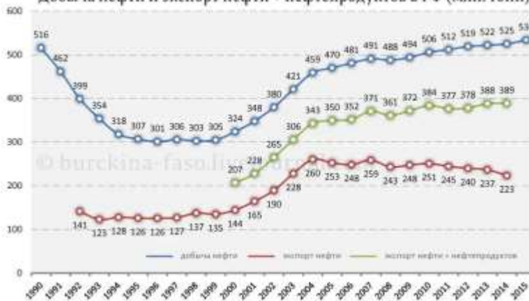
Добыча нефти и экспорт нефти • нефтепродуктов в РФ (млн. тонн)